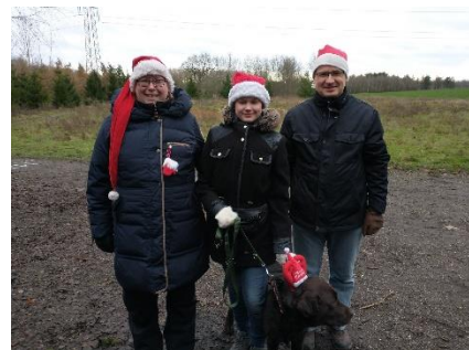
Familietur i Ringsted

Stemmingsbilleder fra nogle af vores startsteder.